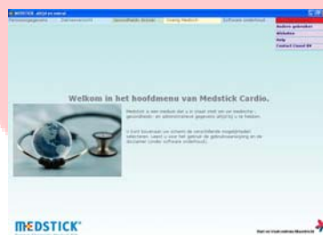
Hoofdmenu van Medstick Cardio